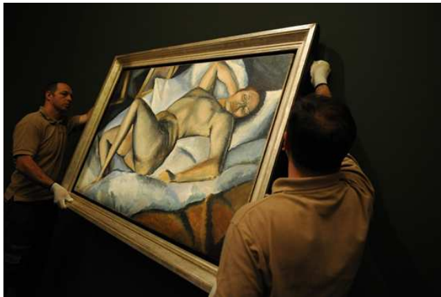
A Nagy akt felkerül a Szépművészeti falára