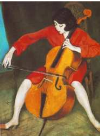
Berény Róbert: Csellózó nő

És változnak az idők, korszakok, stílusok az emberek is, így a művészek is és születnek további művek pl: