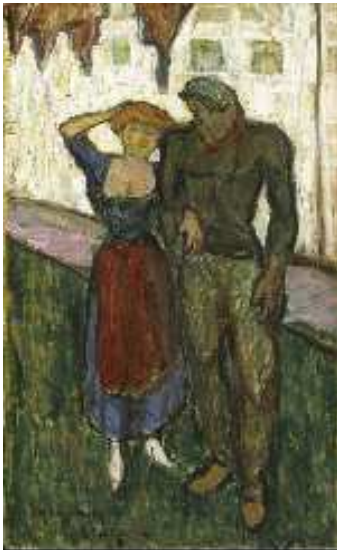
Egry József: Szerelmesek 1911.

Valóban az volt a kiállítás érdekessége, hogy nem csak a jól ismert balatoni képeket mutatta be (I. emelet), hanem a korai alkotásokat is (II. emelet)