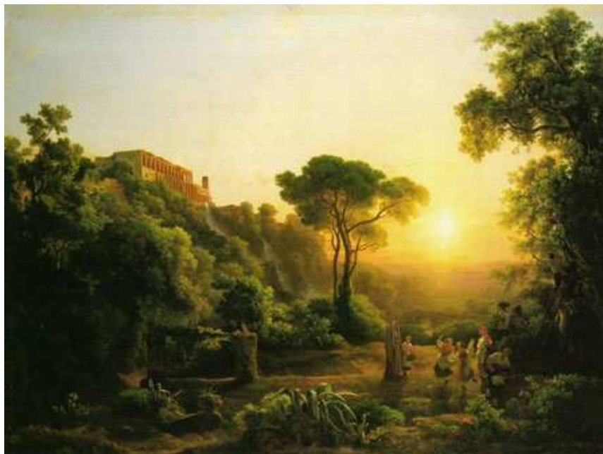
id. Markó Károly: Tájkép Tivoli mellett

Magyar Nemzeti Galéria id. Markó Károly és köre, Mítosztól a képig c. kiállítás