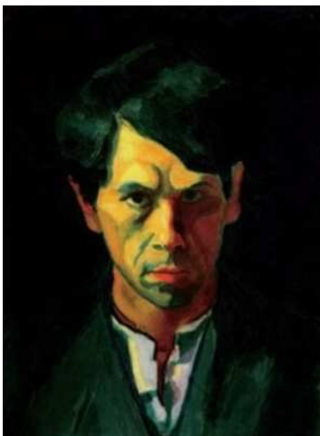
Czigány Dezső önarcképe 1909-ből

Tihanyi Lajos avantgárd festő, akit a posztimpreszionista Paul Cézanne művészete és stílusa ihletett meg, az 1920-as évek végén Párizsba tette át székhelyét. Előtte viszont meglehetősen bohém életet élt a fővárosi házban, melyben rajta kívül a Nyolcak harmadik tagja, Márffy Ödön is lakott. Márffy szemet hunyt Tihanyi zajos életvitele és változatos nőügyei felett: korabeli beszámolók szerint a Kassák Lajos és Ady Endre arcképét is megfestő Tihanyinál mindig volt hölgytársaság.