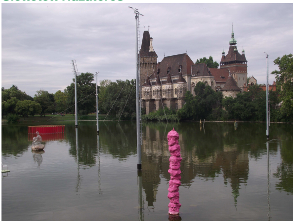
Krzysztof M. Bednarski: Oszlop- Szökőkút