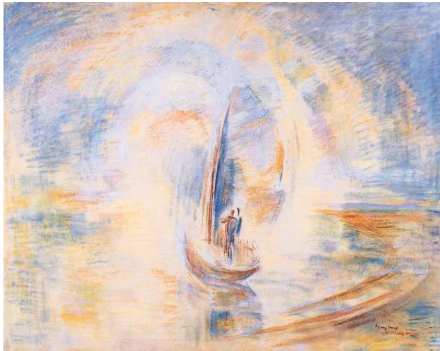
Egry József 1883-1951. Aranykapu c. képe

Valóban az volt a kiállítás érdekessége, hogy nem csak a jól ismert balatoni képeket mutatta be (I. emelet), hanem a korai alkotásokat is (II. emelet)